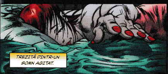
TREZITĂ DINTR-UN SOMN ABITAT.