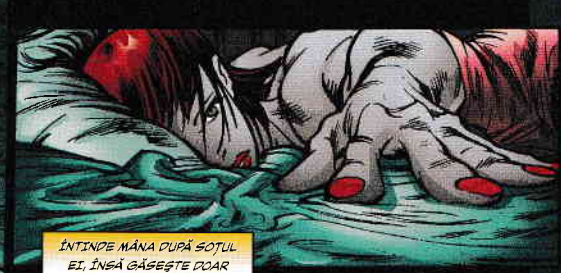
INTINDE MÂNA DUPĂ SOȚUL EI, ÎNSĂ GĂSEȘTE DOAR AȘTERNUTURILE RECI